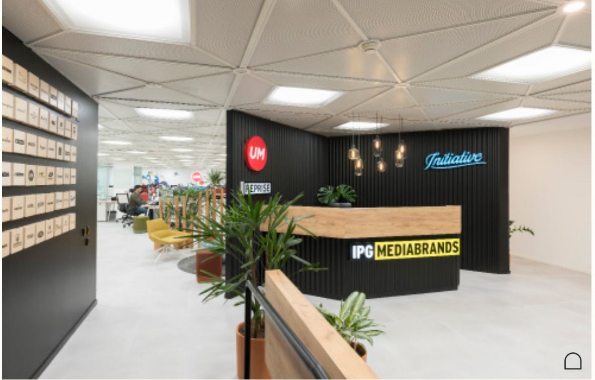
Project: Mediabrand, Offs. Entrance / Building Façade